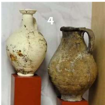
Kruik wijn/ water (IB4) Torenmuseum

Waar vind je sporen van de Romeinen in de gemeente Katwijk die gaan over koken en eten?