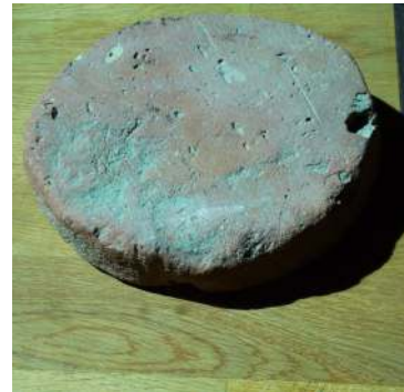
Tegel badhuis Katwijk's Museum