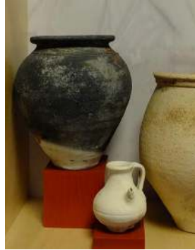
Kookpot/ urn (IIIB2) Torenmuseum