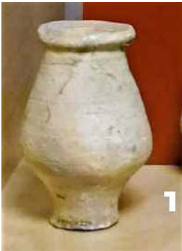
Zalfpotje (IA1) Torenmuseum

Waar vind je sporen van de Romeinen in de gemeente Katwijk die gaan over mode en verzorging?