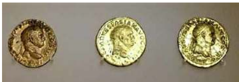
Munten (IIB 1) Torenmuseum

Waar vind je sporen van de Romeinen in de gemeente Katwijk die gaan over winkels en handel?