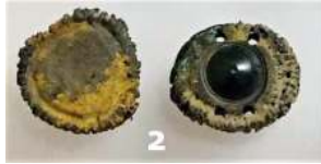
Amulet van rozet van hertengewei (IIIA2) Torenmuseum