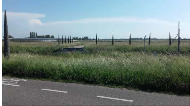
Resten van een Romeinse weg bij de N206. Door wegwerkzaamheden is deze weg op dit moment niet te zien. In 2023, na de werkzaamheden, is de Romeinse weg gemarkeerd en weer te bezoeken.