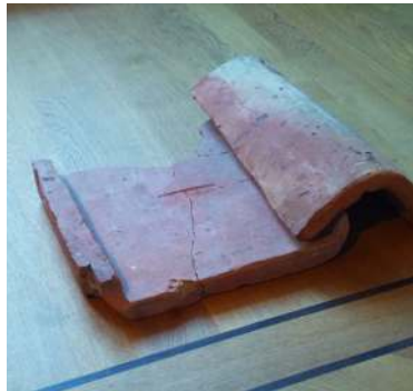
Dakpan Katwijk's Museum