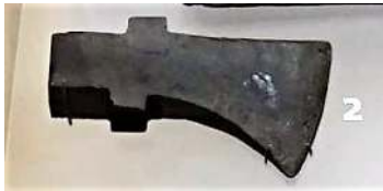
Bijl (IA2) Torenmuseum

Waar vind je sporen van de Romeinen in de gemeente Katwijk die gaan over gebouwen?