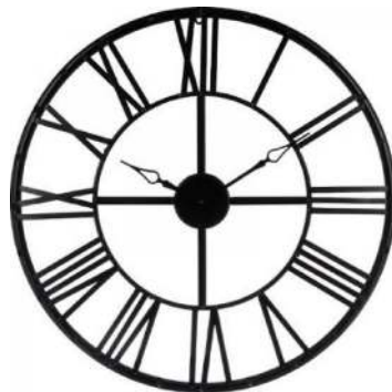
Kerkklok Romeinse cijfers