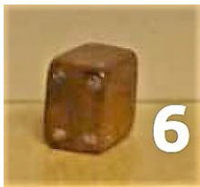
Dobbelsteen IIB6) Torenmuseum

Waar vind je sporen van de Romeinen in de gemeente Katwijk die gaan over school en spelen?