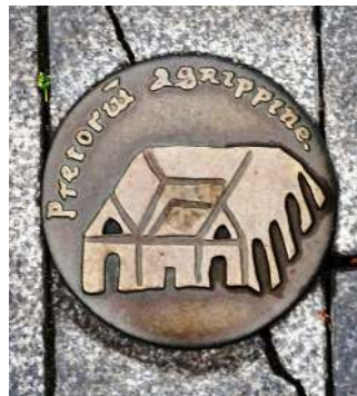
Markering Fort Valkenburg