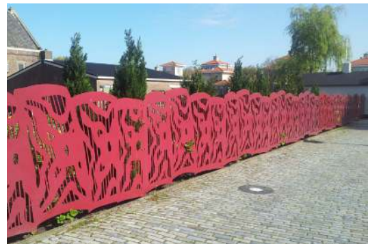
Hekwerk Romeinse schilden, Veepad, in Valkenburg