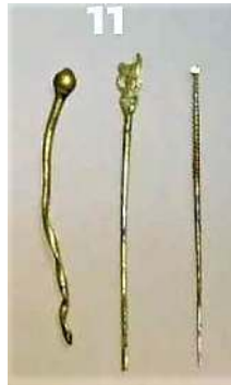
Haarspelden (IIA11) Torenmuseum