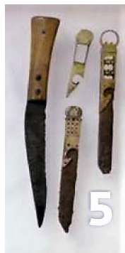
Messen (IC6) Torenmuseum