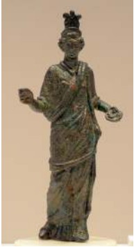
Beeldje Isis (IIIA1) Torenmuseum

Waar vind je sporen van de Romeinen in de gemeente Katwijk die gaan over leven en dood?