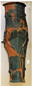
Been- beschermer (IIB8) Torenmuseum

Waar vind je sporen van de Romeinen in de gemeente Katwijk die gaan over het Romeinse leger?